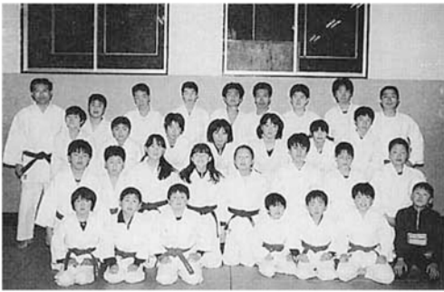
サークル紹介 ③④ 《川口柔道会》

昭和45年の発足以来、一貫して持続力と思いやりをモットーに活動しています。大きい体の中学生が小さな小学生にうまく投げられてやっている姿を見ると、いじめの問題など無縁にさえ思えます。年に一回夏の合宿キャンプもあり、子どもたちの楽しみにもなっています。