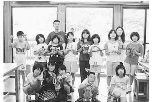
かわぐちっこクラブ 「自然イラスト教室」

7月16日、交流体験館「杜のかたらい」において自然イラスト教室が行われ、各小学校児童16名が参加、流木アートにチャレンジしました。 いろいろな形をした流木を手に取り、どんなものを作ろうかイメージを膨らませ、製作開始。いざとりかかると、万力やノコギリなど普段使ったことのない道具に四苦八苦！でも、自分自身で作った力作を見て大満足！ ひとつの棒切れから、いろいろな作品が生み出される楽しさを満喫した一日でした。