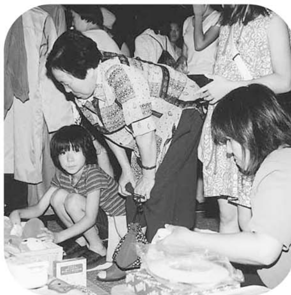
▲ フリーマーケット