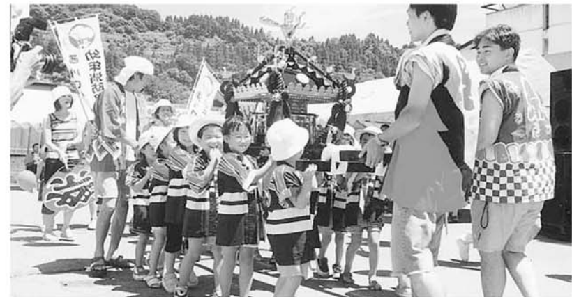
▲ 保育園児のみこしかつぎ