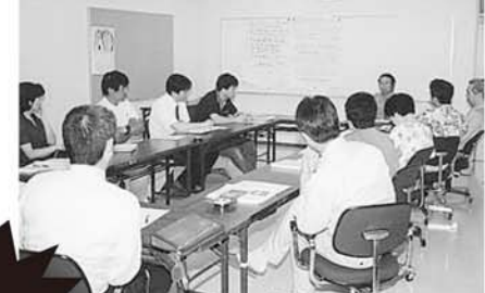
■えちごかわぐち物語創造部会

人づくり部会では、「まちづくりは人づくり」を合言葉に、2月から4回の部会を重ねています。 町民参加型まちづくりを目指すために、まず部員自らの教養を深めるといことで、生涯学習推進の意義についての勉強、県庁地域政策課よりワークショップの手法等の講義を受けてきました。 これからの活動としては、町民、特に若者のニーズを把握するために、各種アンケート結果を分析、検討を行う予定です。