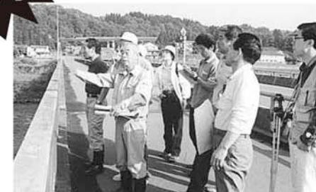
■ふるさとの顔づくり部会

気軽に声がかかけあえる町の雰囲気づくり・町の特徴づくり・自然景観を守るなど、部員の方から多くの意見が出され、まずは、自分の住む町を良く知ろうということから始まった地域めぐりも無事終了。 その地域に詳しい方から案内していただき、狭い川口ながらも、まったく知らない場所、景観、由来などを知ることができ、多くの収穫を得ることができたのではないだろうか。今後、この活動をもとに川口町の「顔」となるものを提案するための研究をしていきます。