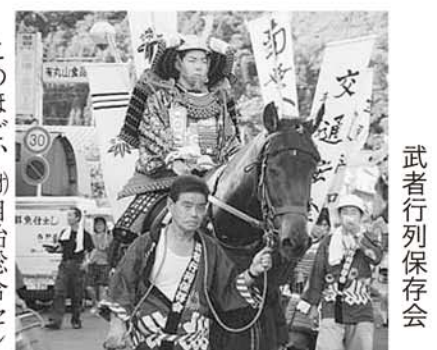
新しい武者鎧で 川口まつりにいざ出陣!! 武者行列保存会

このほど、(財)自治総合センターによる宝くじ普及広報事業の助成により、大鎧1体と胴丸鎧4体を購入しました。毎年夏まつりでは武者行列が行われていますが、保存会で保有している鎧は、胴丸鎧1体のみ。他は個人から借用していたので、以前より新しい鎧の購入を強く望んでいたところでした。 今年のまつりで早速、新しい鎧を身にまとった武者の凛々しい姿が披露され、大歓声をいただきました。 今回の助成による鎧の購入は、保存会の活動並びに町の活性化に大きな役割を果たしてくれそうです。