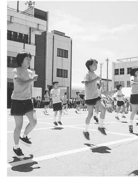
▲ 子供ジャズダンス