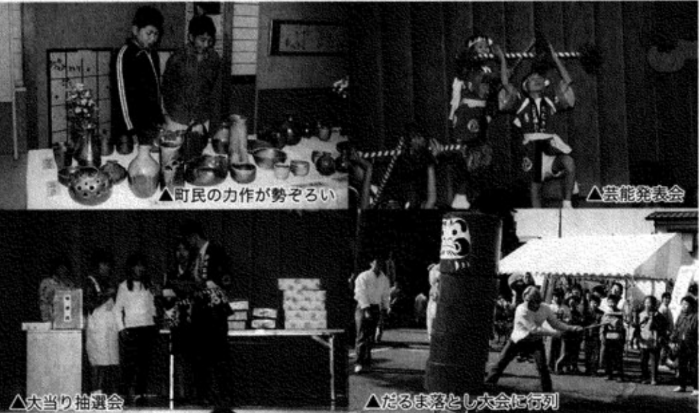
△町民の力作が勢ぞろい