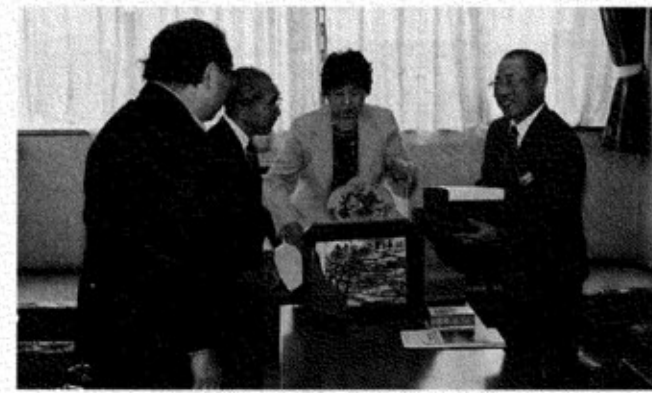
小学校等で活用していきたいと考えています。

昭和初期までの光景が詰め込まれています。一つの場面につき語りは1分程度、子どもたちになじみやすいようにと、お年寄りが孫に語り聞かせるような言葉が選ばれています。 また、カルタ「狛江昔物語」は、狛江市内の名所旧跡などを題材にし、郷土に親しんでもらおうと作り手を市民から募集したところ、小学生を含む29名の応募がありました。市内を実際に歩き描かれた札は、一枚一枚に郷土を思う心が込められています。 町では、ふるさと友好都市狛江市を知ってもらうことと、昔のくらしを知ってもらうために