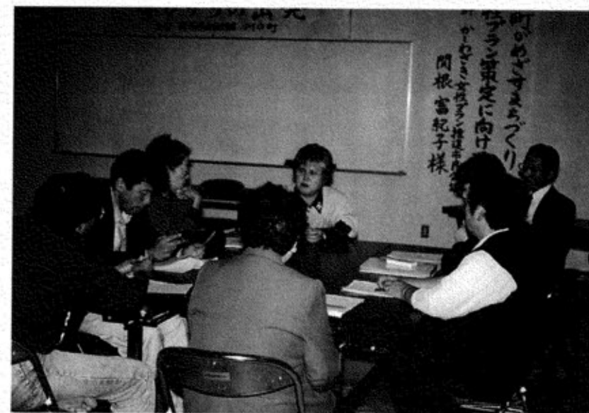
第5回男女が共にあゆむまちづくりセミナー

10月まで5回行われた「男女がともにあゆむまちづくりセミナー」では、延べ80人の男女が参加、「男らしく、女らしくから自分らしく生きるために」をテーマに、気づきの学習を行いました。