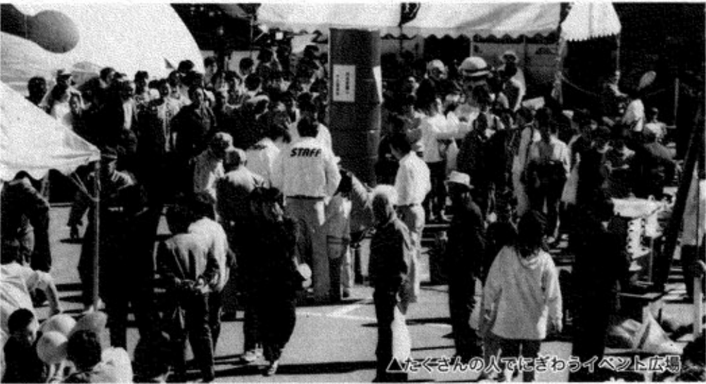
△たくさんの人でにぎわうイベント広場