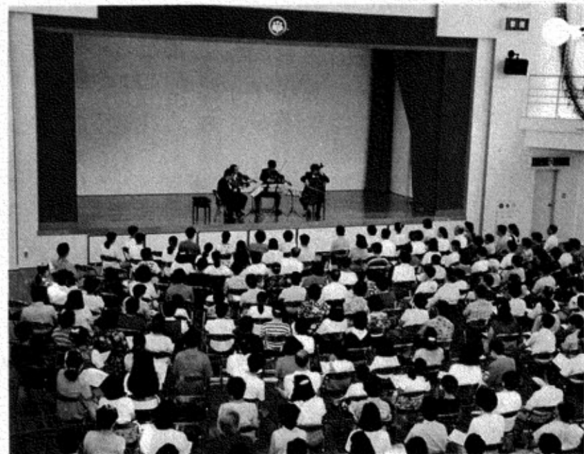
▲広域的な学習機会の提供として開かれた信濃川文化推進事業「サマーコンサート」(昨年7月)

町では、より充実した生涯学習を進めるために、長岡広域圏内の関係機関、団体と連携した信濃川文化推進事業をはじめ、小千谷市、津南町と連携したモデル広域学習圏事業や新たに生涯学習ボランティア養成講座の開設などの計画を進めています。