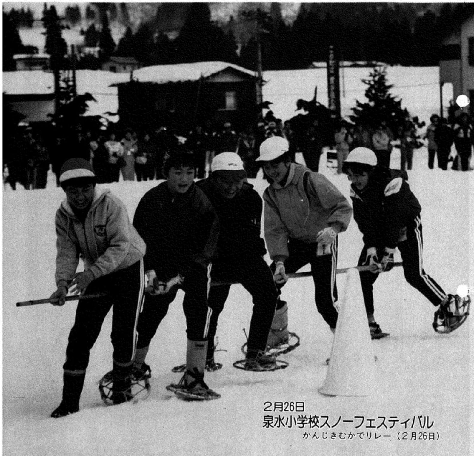
2月26日 泉水小学校スノーフェスティバル かんじきむかでリレー (2月26日)

発行 新潟県川口町長 青柳 弘 編集 川口町役場総務課 (〒949-75 ☎(0258)89-3111)