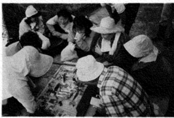
ふるさと川口塾「きこの見分け方の学習」