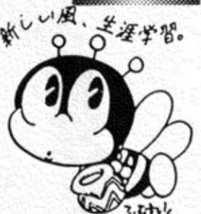
生涯学習のマスコット「マナビイ」