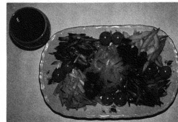
1人当たりカロリー 85kcal